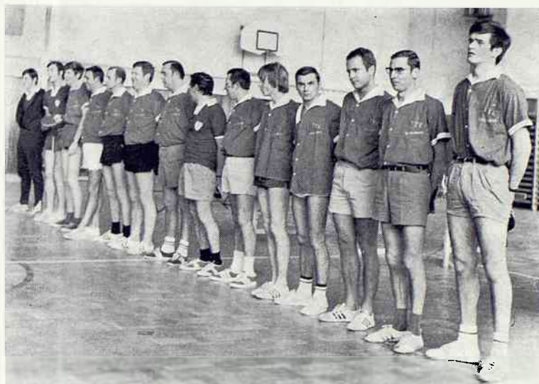
Equipe de Ping-Pong de « Brühl »

Cette rencontre s'est déroulée dans une atmosphère de chaude amitié et nos joueurs se rendront vraisemblablement à Brühl l'année prochaine.