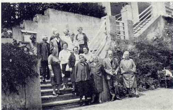
Le rassemblement avant de partir en excursion

Il nous reste le souvenir de ces belles journées, qui ont passé trop vite à notre gré.