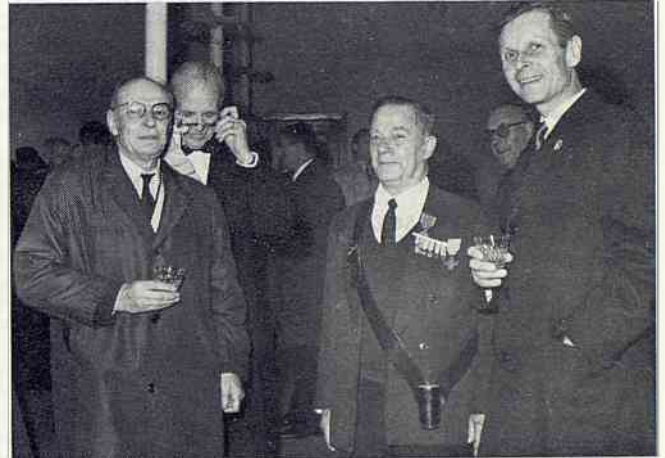
La côte 304, M. le Maire, on y était...