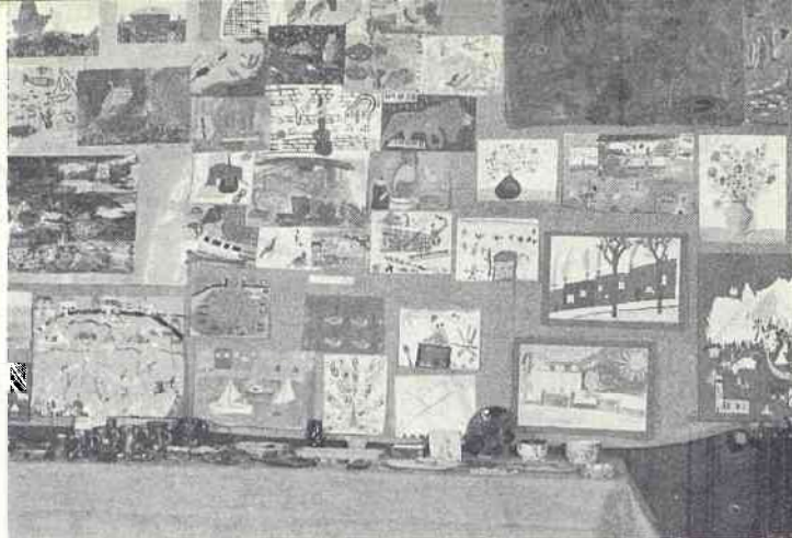
Une vue de l'exposition de travaux artistiques réalisés par les élèves de l'Association Culturelle de Sceaux et du Val de Bièvre.