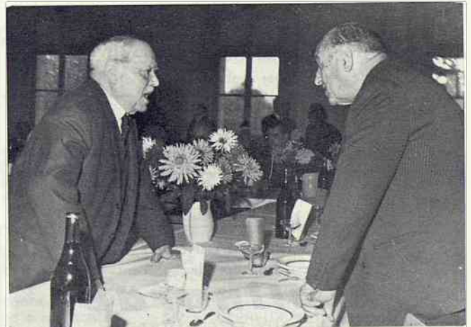
Quand un aviateur rencontre un artilleur...

Reportage photographique de Jacques Rondeau.