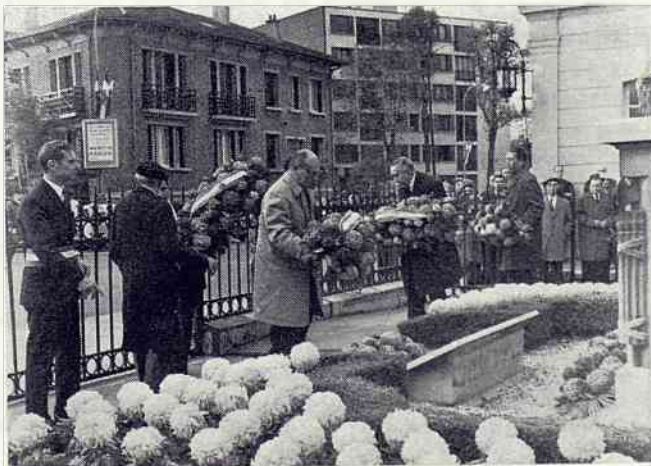
Le dépôt des gerbes