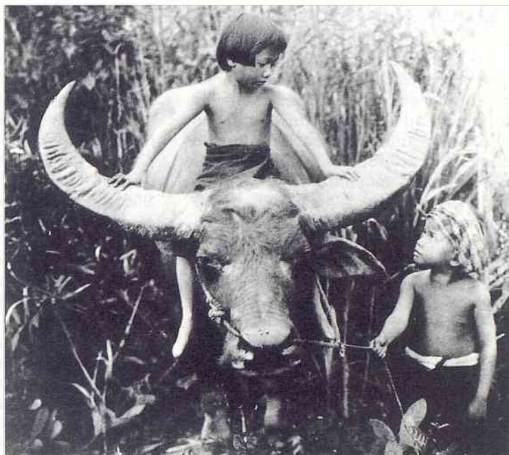
Chang , à l'affiche du Trianon en février : Au Siam, en pleine jungle, un paysan et sa famille vivent paisiblement jusqu'au jour où un "Chang" endommage leur culture de riz...

Il organise également des soirées-rencontres. Tel soir, c'est l'histoire du film qui sera abordée, tel autre, les motivations du metteur en scène, sa démarche cinématographique, ou bien les aspects techniques de la réalisation, etc. Le dialogue qui s'instaure alors entre les professionnels et le public est un moment unique, et la soirée cinéma devient une rencontre conviviale, chaleureuse où la même passion du cinéma se partage.