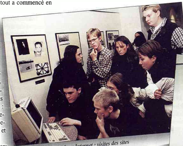
Surf sur Internet : visites des sites