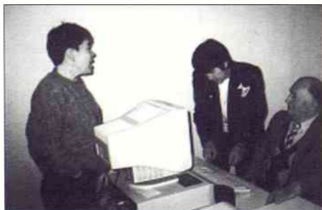
Les monitrices, aveugle et voyante, au cours de formation.

L'assemblée générale de l'association se tiendra le mardi 2 février à 20 h 30, dans une salle de la MJC.