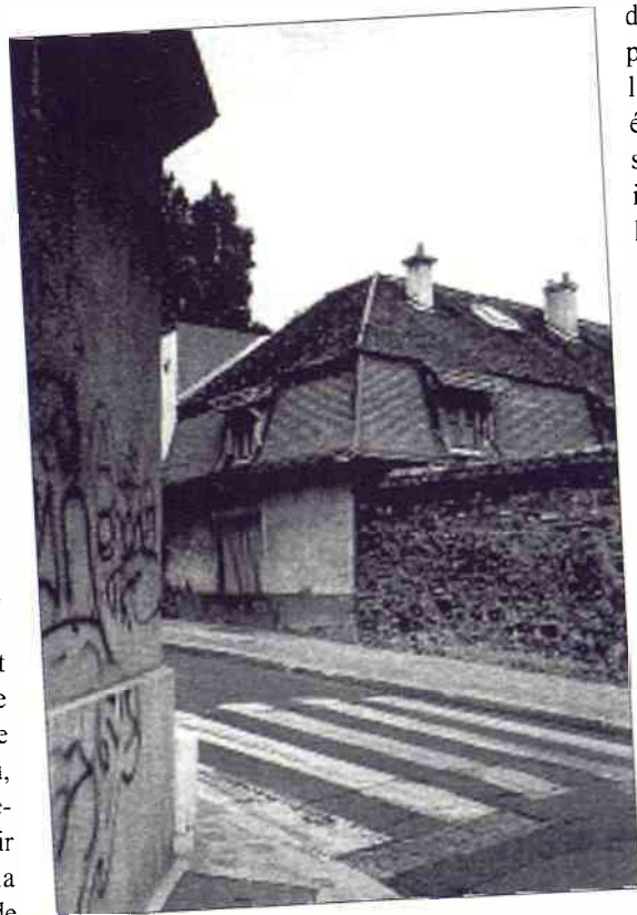
"La Courge" vue de la rue du Dr Berger

Disponible au siège de l'association (bibliothèque municipale, rue Honoré de Balzac, 92330 Sceaux : permanence tous les samedis après-midi, hors vacances scolaires).