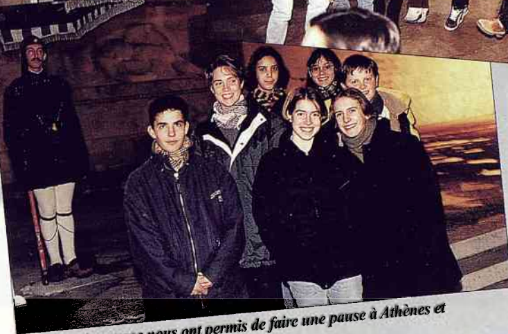
Les aléas du voyage nous ont permis de faire une pause à Athènes et d'assister à la relève de la garde.