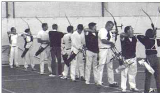
Alignement de tireurs au gymnase des Blagis pour le concours en salle des 12 et 13 décembre 1998.

Compagnie d'arc 7 rue Bagno a Ripoli 92350 Le Plessis-Robinson