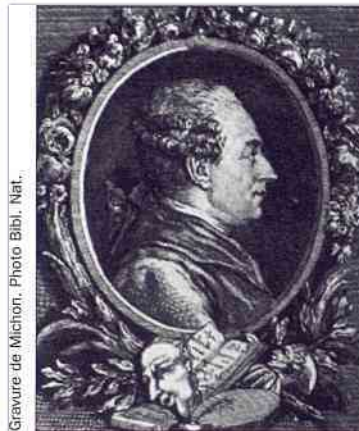
Pierre Augustin Caron de Beaumarchais

M. de Beaumarchais, tout court, en 1758. Il se fit aussitôt composer un sceau à ses armes : "de gueules à un lion d'or et à une bande de vair brochant sur le tout" : nouvel état qui lui ouvrit quelques portes, mais lui en ferma bien d'autres !... Mais je