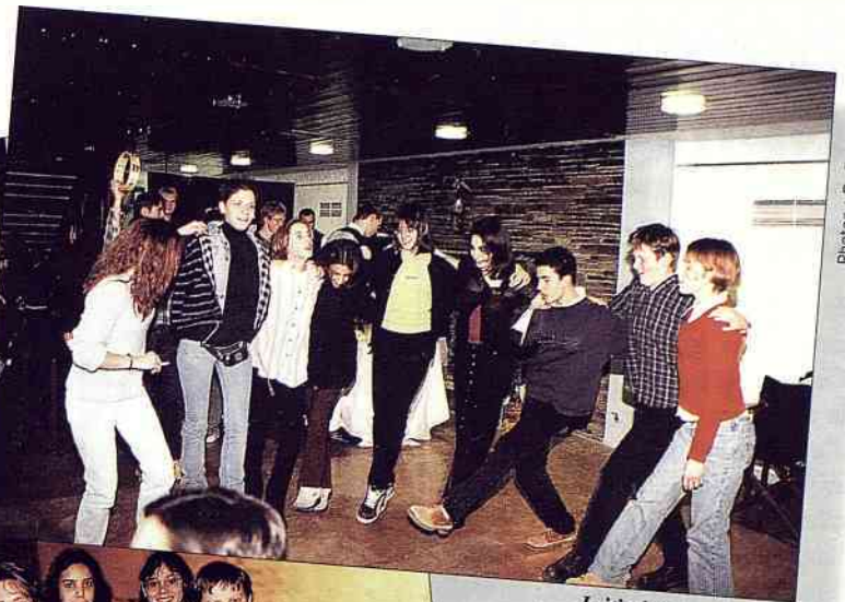
Initiation au sirtaki...