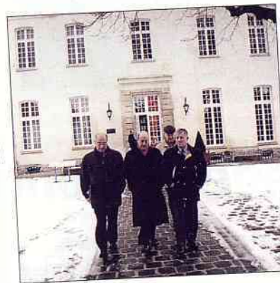
Devant le Petit Château (CAUE 92).