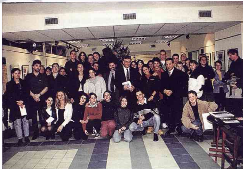
Rassemblement de tous les participants accueillis par des personnalités grecques.

La prochaine rencontre se déroulera à Brühl au mois de juin 1999 où un grand rendez-vous est prévu avec tous les partenaires de ce projet européen.